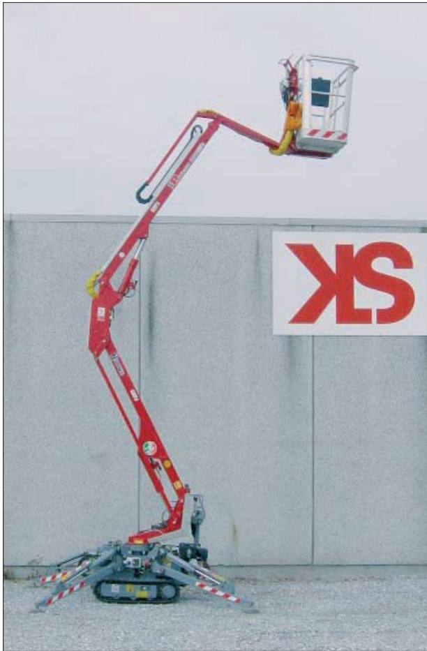
STRØMUDTAG I KURV